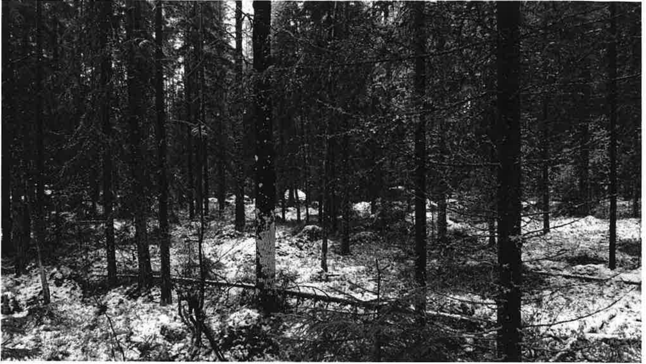
Monimuotoisuutta lisääviä haapoja kasvaa siellä täällä.