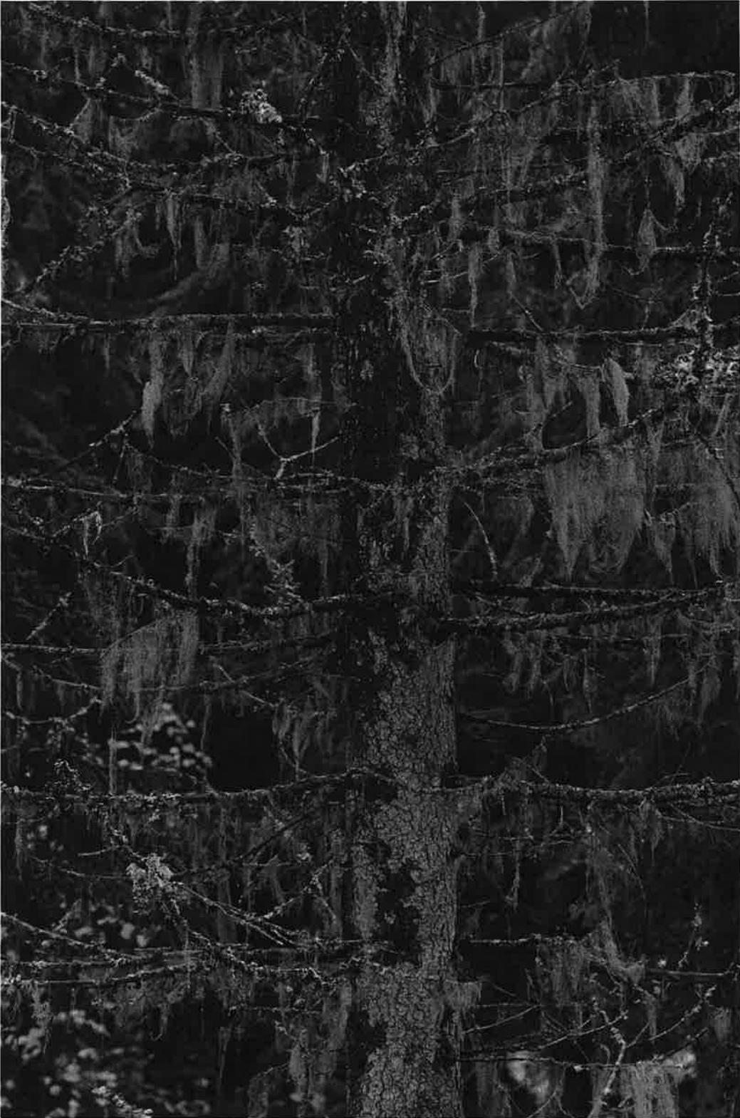
Naavat ja lupot ovat alueella varsin runsaita.