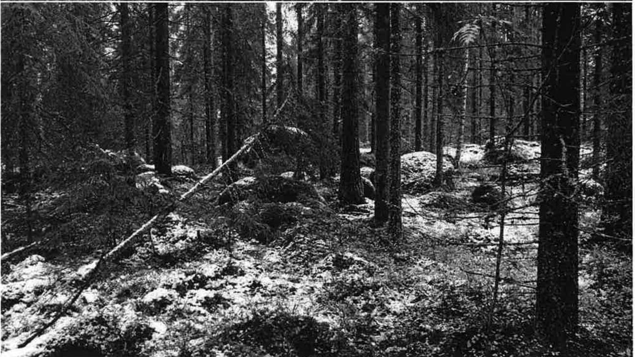
Soidinkallion vanhoja metsiä.