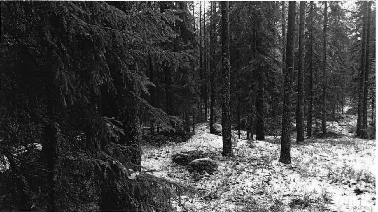
Luonnontilaista korpea ja hyvin myös virkistyskäyttöön soveltuvaa kangasta Soidinkalliolla.